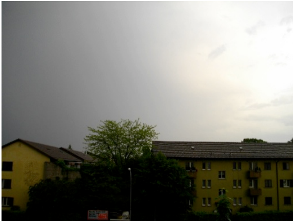
Abb. 10 Wetterlage