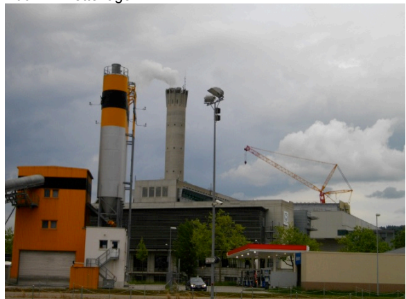
Abb. 13 Peripherie