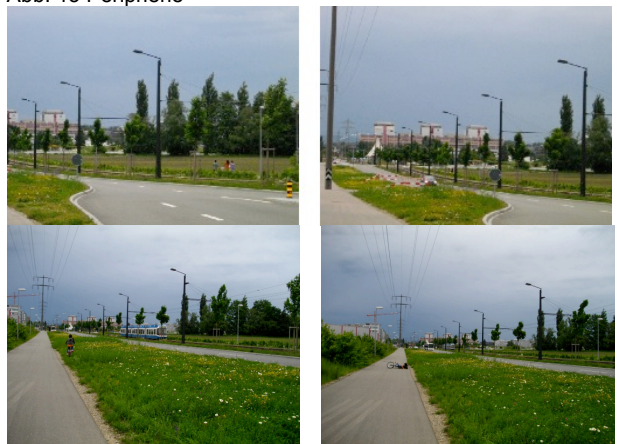
Abb. 15 Peripherie