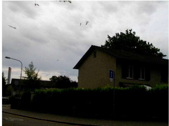
Abb. 11 Wetterlage